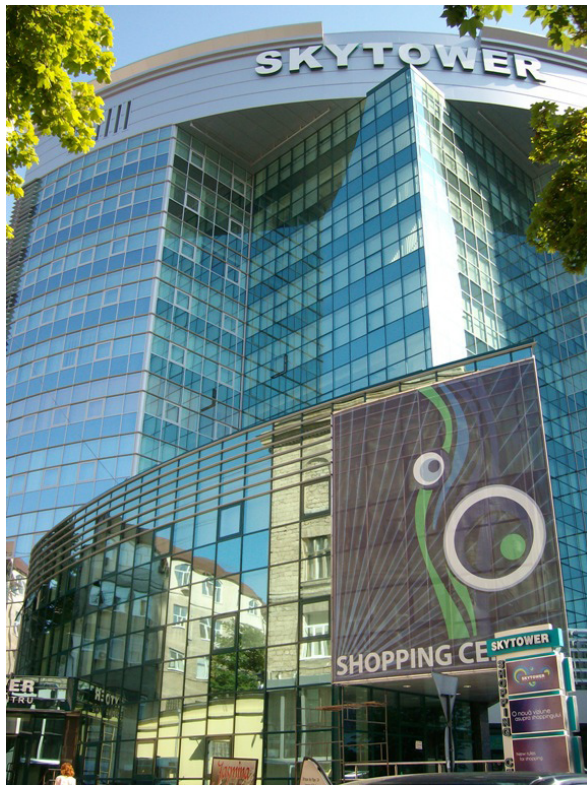
Der soeben fertig gestellte neue Business Center „Sky Tower“ im Zentrum von Chişinău

geschädigt worden und Betriebe mussten ganz ihre Arbeit einstellen. Obwohl das Krisenmanagement der Regierung abwartend verlief und wiederholt den Anschein vermittelte, die alte Abhängigkeit von Russland nur einfach wieder herstellen zu wollen, so konnte sie jedoch schlecht den betroffenen Firmen die Suche nach Kunden in neuen Ländern verbieten.