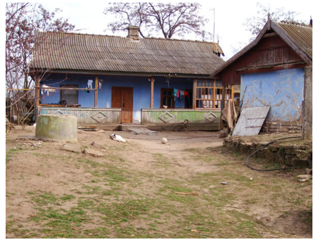
Die Lebensbedingungen der meisten Menschen auf dem Land lassen zu Wünschen übrig.

Moldova und Transnistrien das Land sowohl politisch, als auch wirtschaftlich zu kontrollieren zu kontrollieren werden nicht völlig unbeachtet bleiben, doch das Meinungsbild in der Bevölkerung zugunsten Europas kaum mehr verändern können. Der Anteil der Moldauer, die