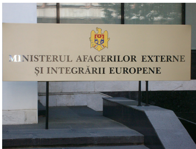
Ministerium des Äusseren und der europäischen Integration: Offizielle Bezeichnung des moldauer Aussenamtes, die seit ein paar Jahren offiziell gilt

Eine nachhaltige positive Entwicklung Moldovas wird nichtsdestotrotz nur dann stattfinden, wenn das Land seine gegebenen Vorteile im Wirtschaftsleben zu bewahren und zu nutzen weiß. Dazu zählt die vorhandene Doppelsprachigkeit Rumänisch